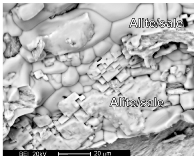
Immagini al microscopio elettronico a scansione di cristalli di sale sulle ossa di pesce studiate