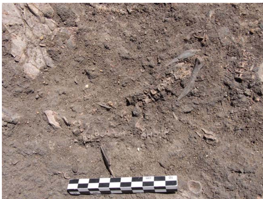
Resti di pesce vecchi di diecimila anni rinvenuti durante lo scavo del sito archeologico di Al Khiday