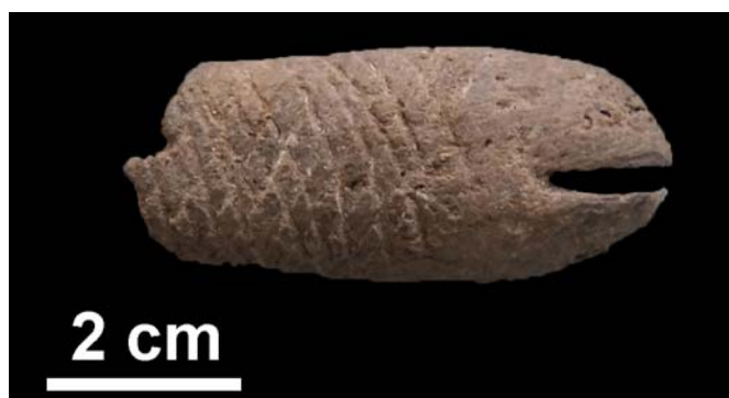
Elemento decorativo a forma di pesce di epoca Mesolitica rinvenuto durante lo scavo di Al Khiday