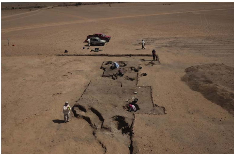
Il sito archeologico di Al Khiday durante lo scavo